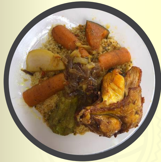
Cous cous/ Cuscús Fertilidad, abundancia y amor familiar